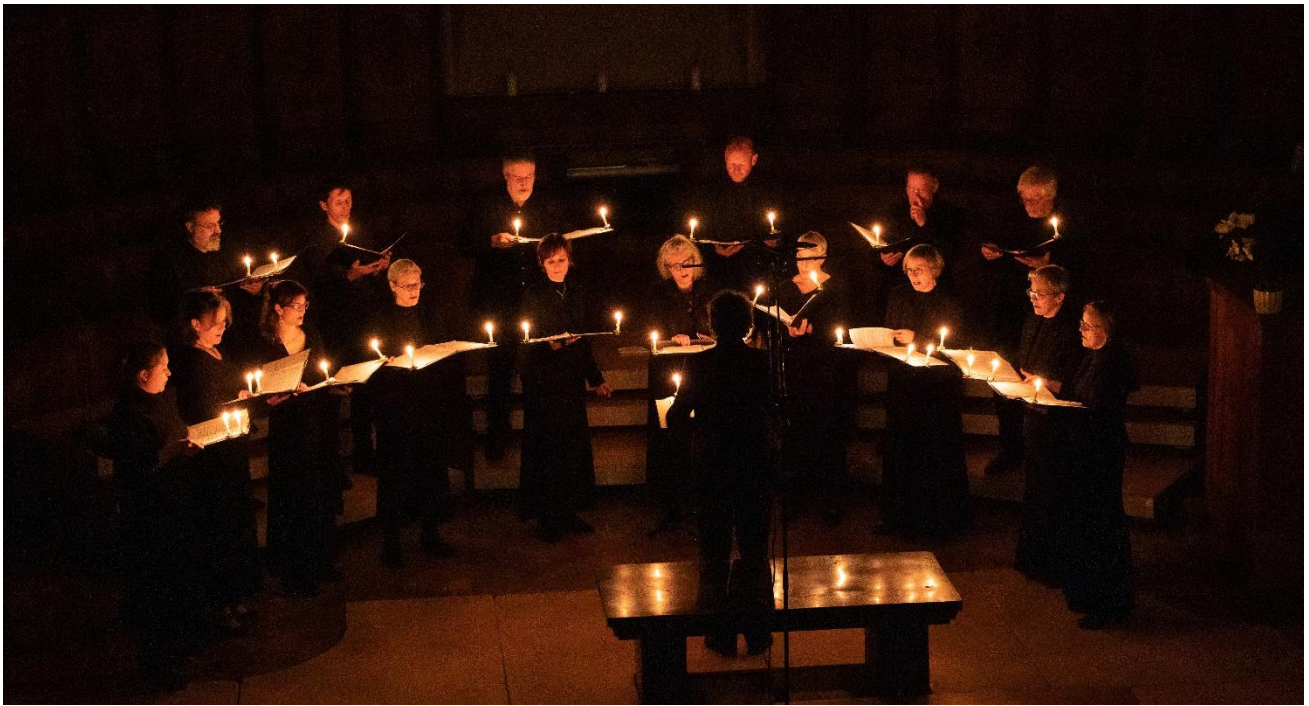
Le chœur Yaroslavl au Temple de Bex, déc. 2022

CHŒUR YAROSLAVL DIR. Y. GREPPIN CHŒUR DE JEUNES LINIYA DIR. V. HAMMANN AVEC FRANÇOIS CLAVEL, PERCUSSIONS